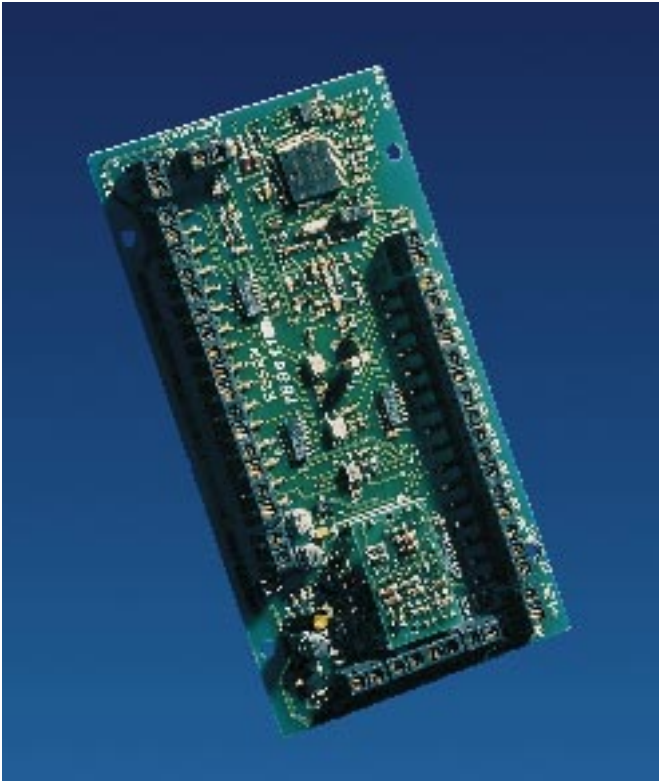
esserbus®-Koppler eK-32AE (Sach-Nr. 788611)

Der esserbus®-Koppler mit 32 LED-Ausgängen ist ein intelligenter Problemlöser. Mühen Leuchtdioden, wie beispielsweise in einem Parallelanzeigetableau, bisher direkt über die Brandmelderzentrale wie die essertronic® 8007 oder 8008 angesteuert werden, so erledigt das der neue esserbus®-Koppler dezentral aus nächster Nähe.