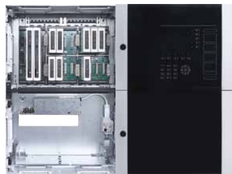
Service-Massnahme: Türen geöffnet und seitlich arretiert.