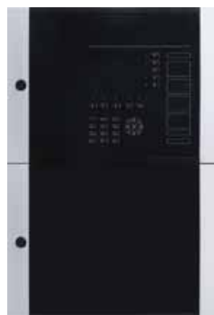
Betrieb: Türen verschlossen.

Neu sind die beiden seitlich angeschlagenen Gehäusetüren, wobei der Türanschlag rechts oder links variabel ausgeführt werden kann.