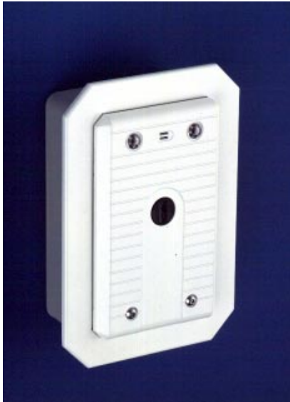
Option unter Putz Wandeinbau