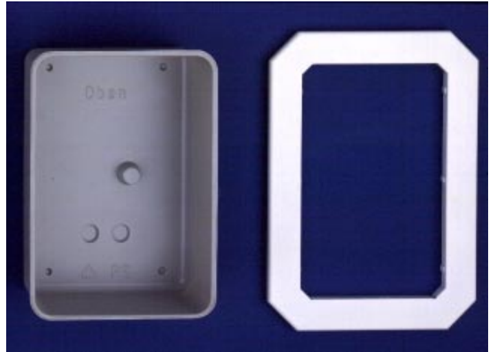
Einzelteile Option unter Putz Wandeinbau