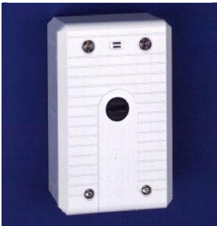
Schlüsselschalter SS 90