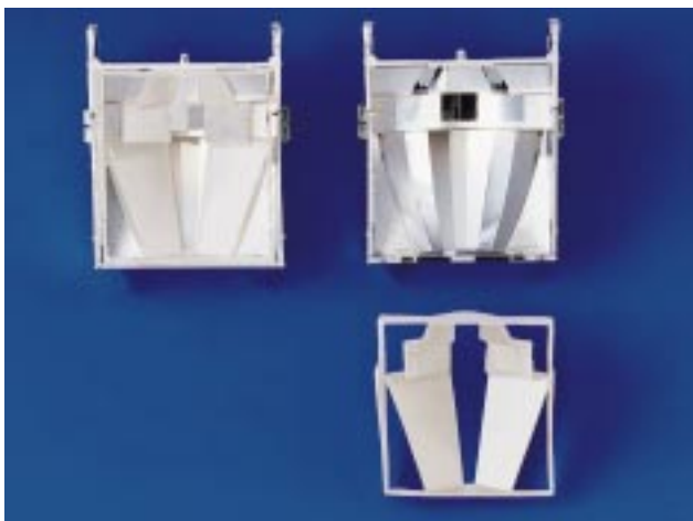
Erfassungsbereiche können optimal durch eine einfache Abdeckung angepaßt werden

Hinter dem formschönen und funktionellen Design steckt intelligente Technik. Vielseitige Einsatzmöglichkeiten und ein Höchstmaß an Installationsfreundlichkeit sind die Folge. Durch ausgefeilte Details können der ISO 6210 und der ISO 6230 flexibel an die unterschiedlichen räumlichen Gegebenheiten angepaßt werden. So ist die Optik auch in der Hochachse verstellbar: Dadurch ist auch bei unterschiedlicher Raumgröße eine optimale Überwachung möglich.