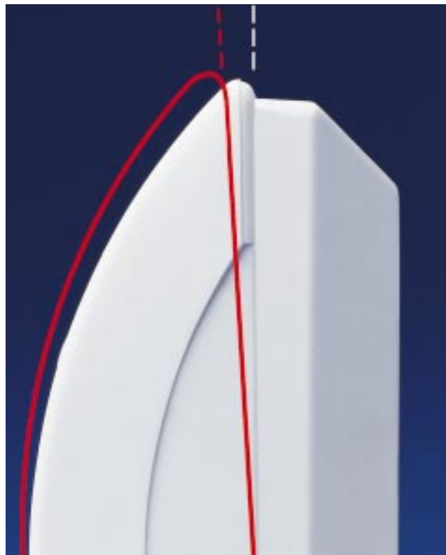
Die Reichweiten des ISO 6210 und ISO 6230 lassen sich über die Gehäuseschraube justieren