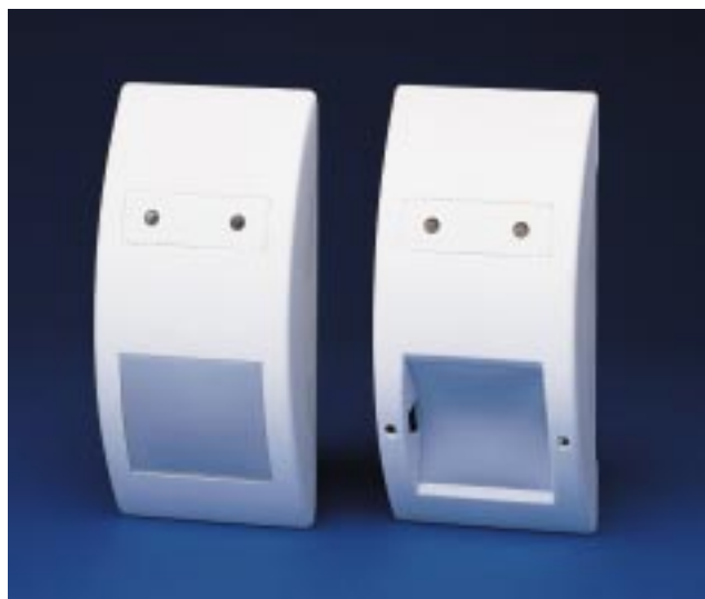
Passiv-Infrarot-Bewegungsmelder ISO 6210 und ISO 6230