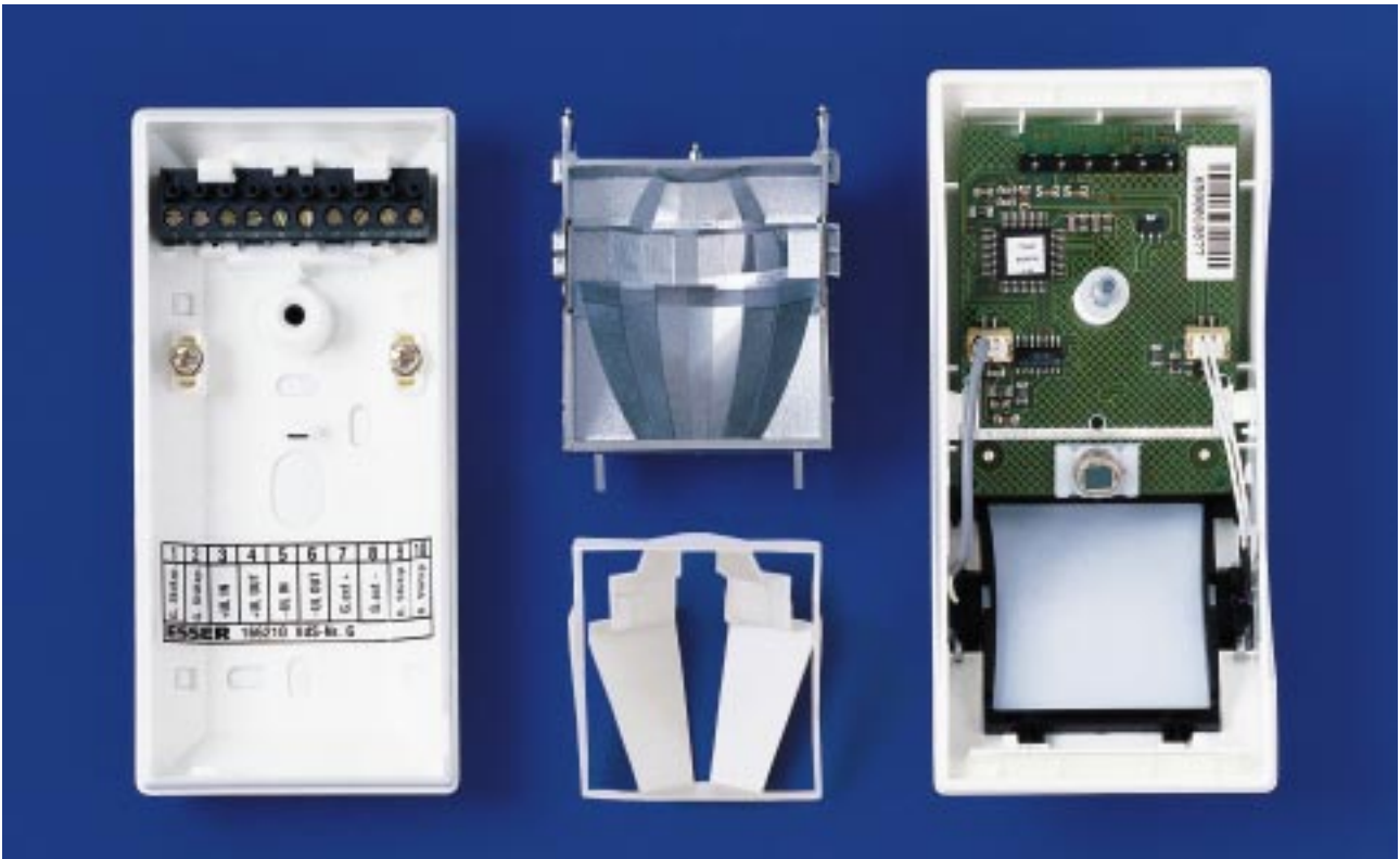
Durch modularen Aufbau sind der ISO 6210 und ISO 6230 besonders montagefreundlich