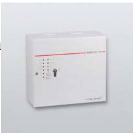
Gefahrenmelderzentrale compact 106